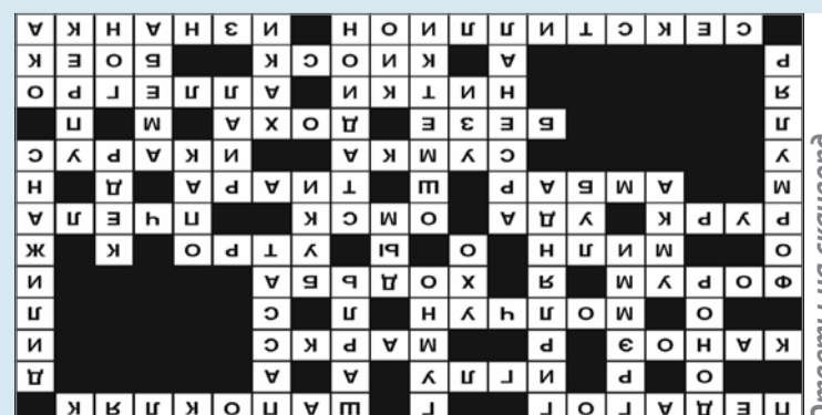
Ответы на сканворд

При проведении согласования местоположения границ при себе необходимо иметь документ, удостоверяющий личность, а также документы о правах на земельный участок (часть 12 статьи 39, часть 2 статьи 40 Федерального закона от 24.07.2007 г. № 221-ФЗ «О кадастровой деятельности»).