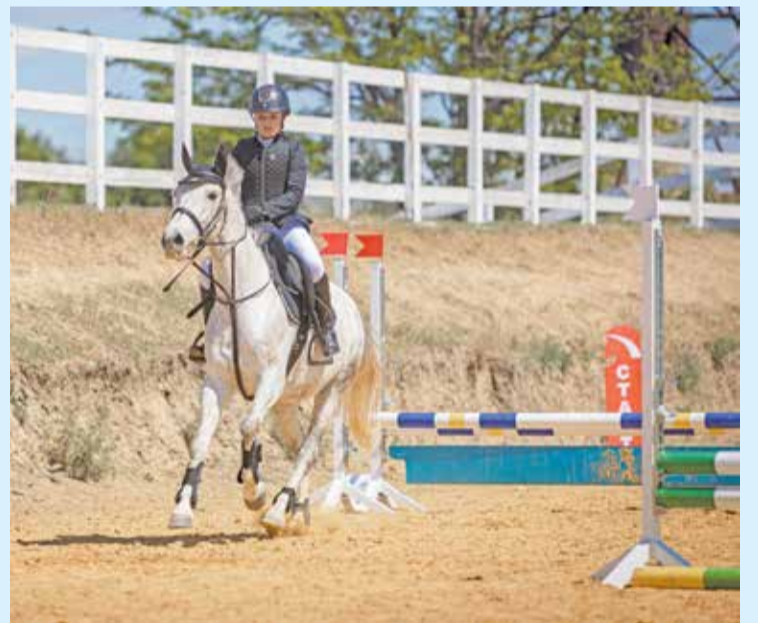
– Особенно приятно, что наши юные всадники не просто продемонстрировали высокий уровень мастерства, но и выполнили нормативы юношеских разрядов. Это большой шаг в развитии конного спорта в регионе. Уверен, что