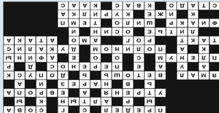
Ответы на сканворд

Важно! Перед подачей декларации проконсультируйтесь в территориальной налоговой инспекции или используйте сервис «Личный кабинет налогоплательщика» на сайте ФНС России. Это поможет правильно оформить документы, избежать ошибок и максимально эффективно использовать предусмотренные законом льготы.