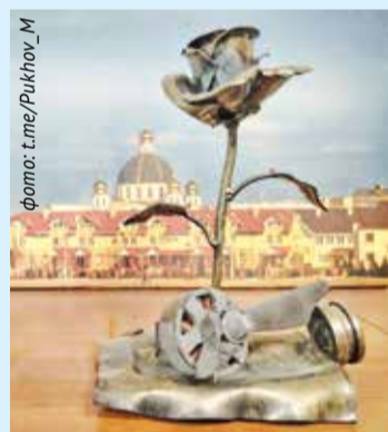
Угроза с неба

При отключениях света разряжаются телефоны, а это вопрос безопасности. Местные предприниматели организовали точки подзарядки – в магазинах, кафе, иногда просто удлинители на улице. Мелочь, но в условиях дефицита электричества такая розетка становится центром притяжения для целого квартала.